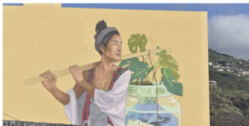
Autor: Andrej Žikić, título: "San Borondón" Mural realizado con Fondos CEE/Estar 2010, Santa Cruz de La Palma.

En el municipio de Santa Cruz de La Palma se ha colaborado con el Ayuntamiento de Santa Cruz de La Palma y la empresa de Construcciones y Reformas Minofra, con el mural “Soñando con San Borondón”, del artista serbio Andrej Žikić, conocido como Artez, ubicado en el lateral de uno de los mayores edificios de la calle Maldonado.