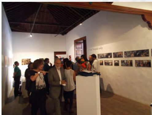
Exposición realizada en el mes de noviembre bajo el título: “Marca Reserva Mundial de la Biosfera La Palma: 10 años trabajando contigo”

juntos, felicitarles por la buena labor realizada, apostando por la calidad, y dar la bienvenida a las últimas incorporaciones, que hacen crecer y madurar nuestra marca. Esperamos seguir aunando esfuerzos para desarrollar nuevas propuestas e iniciativas que contribuyan a promocionar y difundir nuestros productos dentro y fuera del territorio y ello revierta en el desarrollo sostenible de la Reserva Mundial de la Biosfera La Palma.