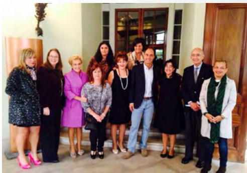
Emprendedoras de Alto Bernesga en torno al Presidente de la Comunidad de Cantabria y responsables de la organización del evento

Las mujeres participantes presentaron su experiencia sobre el desarrollo de negocios agroalimentarios y sobre la gestión de la Asociación de empresarios de la Reserva de la Biosfera Alto Bernesga.