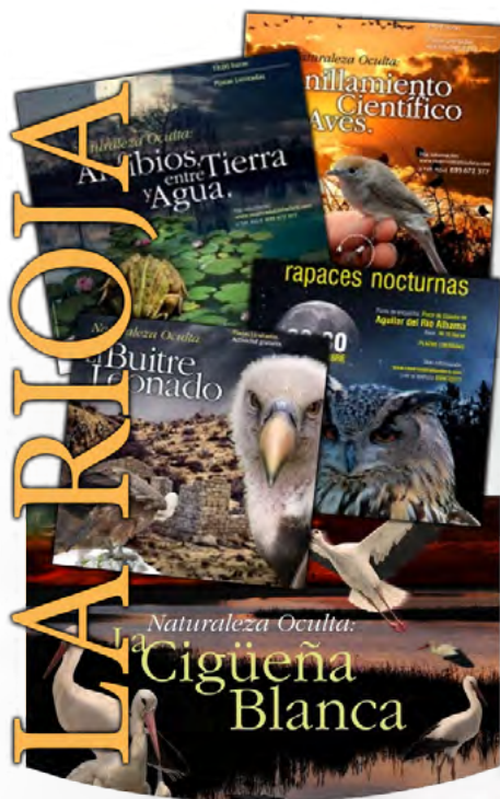
Carteles del programa Naturaleza oculta en la Reserva de la Biosfera de La Rioja