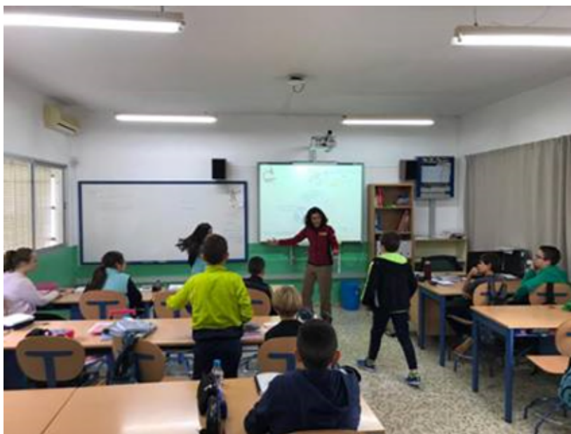
Alumnos de CEIP San Roque (Tolox)

¡Todo@s ell@s son un@s científic@s en potencia!!!