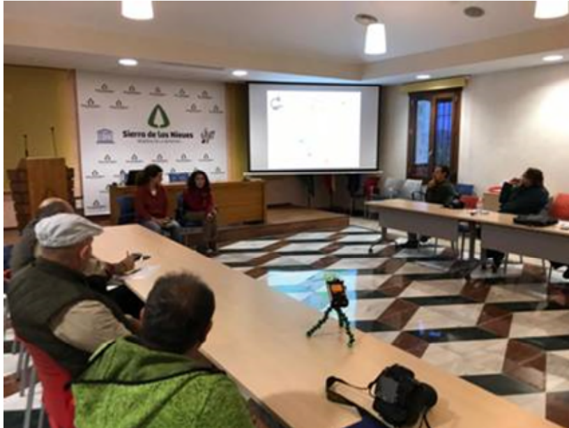
Charla en las Instalaciones de la Mancomunidad Sierra de las Nieves

lugar en las instalaciones de la Mancomunidad Sierra de las Nieves.